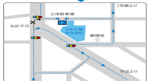
病院付近拡大図(駐車場へのアプローチ)